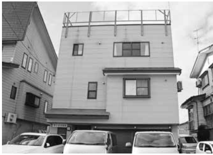
南新田町の事務所

鉄筋業の面白さをうかがうと、やはり完成したときの達成感とのことです。鉄筋業は屋外での作業が主で、夏は暑く冬は寒い体力仕事だけれど、建設基礎工事は50年以上先まで続くような形の残る仕事で、工事が終わり完成した時のやりとげた充実感と完成の喜びは大きいそうです。また現場によって様々な検査基準があり、それに対応し