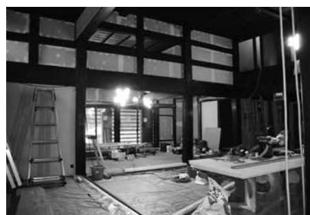
再生中の広々とした古民家

HOME HOME NIIGATA という社名は本来HOME away from HOME で、遠くにあるもう一つの実家という意味に基づいたものなのです。「長くなってしまうので省略したんです。『ただいま』