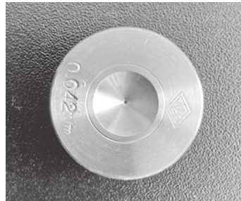
伸線加工で使用するダイヤモンドダイス

長く取引をいただいている業者の皆様を支えられながら徐々に仕事を覚えていったそうです。仕事はタンングステンやステンレスといった金属線を長く、細くする「伸線加工」を行う際に使う工具（ダイヤモンドダイス）の修理・加工ですが、ダイスの穴のサイズは目視では判別がつかないほど小さなものを修理するため、熟練した技術と丁寧さが求められます。